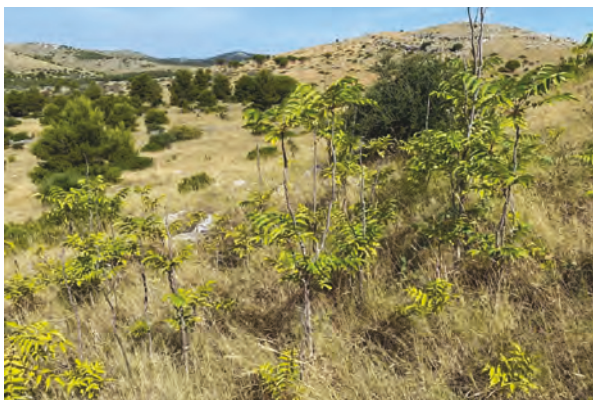
Slika 8. Podmladak i mlada stabla pajasena na području Čuh polja Figure 8. Young trees of Ailanthus altissima in the area of Čuh polje

Na lokalitetu 2. nije uočeno niti jedno žensko stablo u cvatu ili sa sjemenkama pa se pretpostavlja širenje pajasena vegetativno podzemnim putem pomoću rizoma i korjenovog sustava. Za vrijeme kartiranja vaskularne flore na području Parka prirode Telešćica koju su proveli Jelaska i Bogdanović (2007, 2008), na ovom lokalitetu tada nije bio zabilježen pajasen. Infestacija je dakle recentna i stara maksimalno do 15 godina što se da zaključiti iz velikog broja mladih i niskih stabala (Slika 8). Do sada nisu postojali podaci o brojnosti pajasena na istraživanom području te se ovi mogu smatrati nultim stanjem.