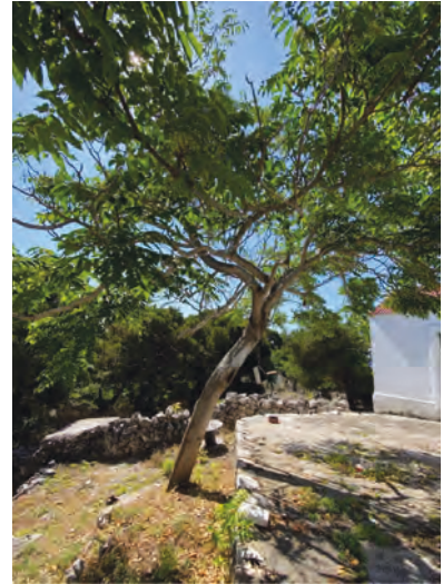
Slika 5. Matično žensko stablo pajasena na području vanjske jugoistočne terase svjetionika Tajer / Figure 5. Mother female tree of Ailanthus altissima in the area of the outer southeast terrace of the Tajer lighthouse

Na lokalitetu 2. – Veli vrh (Smrčevica) u Čuh polju, istraženo je osam ploha. Crvenom linijom prikazan je obuhvat infestiranog područja (Slika 6). Pajasen ovdje ulazi u sastav tipične mediteranske vegetacije suhих travnjaka koji se razvijaju na kamenjaru u kojima dominira vrsta razgranjena koštriva ( Brachypodium retusum (Pers.) P. Beauv.) te ostali mediteranski elementi suhих travnjaka (Slika 7). Unutar istraživanog područja zabilježene su i dvije endemične svojte: pustenasto devesilje ( Seseli tomentosum Vis.) i Tomasinijevo devesilje ( Seseli montanum L. subsp. tommasinii (Rchb. f.) Arcang.).