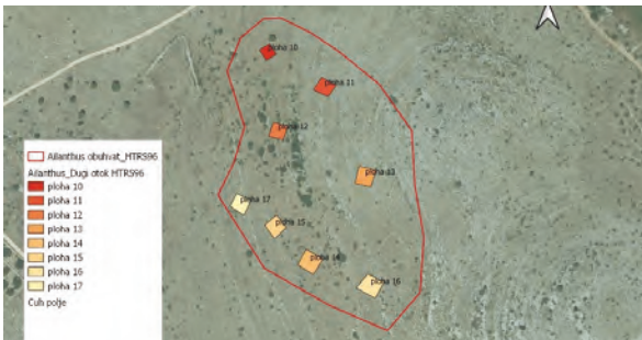
Slika 6. Prikaz istraživanog područja s ucrtanim obuhvatom procjene infestacije (crvena linija) te plohama za kartiranje i prebrojavanje pajasena na području Veli vrh (Smrčevica) u Čuh polju / Figure 6. Presentation of the researched area with the scope of the infestation assessment drawn (red line) and plots for mapping and counting of Ailanthus altissima in the area of Veli vrh (Smrčevica) in Čuh polje / Izvor /Source: Ljubičić, 2023.

Na lokalitetu 2. – Veli vrh (Smrčevica) u Čuh polju, istraženo je osam ploha. Crvenom linijom prikazan je obuhvat infestiranog područja (Slika 6). Pajasen ovdje ulazi u sastav tipične mediteranske vegetacije suhих travnjaka koji se razvijaju na kamenjaru u kojima dominira vrsta razgranjena koštriva ( Brachypodium retusum (Pers.) P. Beauv.) te ostali mediteranski elementi suhих travnjaka (Slika 7). Unutar istraživanog područja zabilježene su i dvije endemične svojte: pustenasto devesilje ( Seseli tomentosum Vis.) i Tomasinijevo devesilje ( Seseli montanum L. subsp. tommasinii (Rchb. f.) Arcang.).