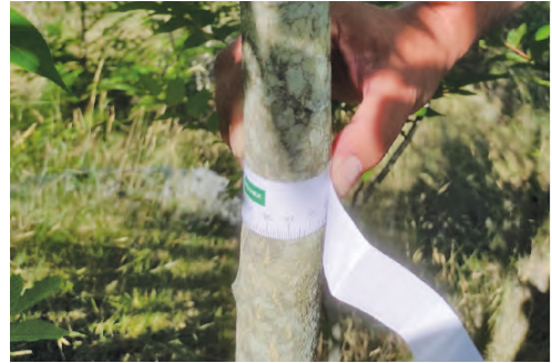
Slika 2. Mjerenje prsnog opsega stabla pomoću metra na visini od oko 1,3 m Figure 2. Measurement of the girth of the tree using a meter at a height of about 1.3 m

Alohtone vrste mogu se očekivati na staništima koja su pod većim antropogenim utjecajem, npr. uz rubove cesta i puteva, obradive površine, opožarene površine i sl. (Boršić i sur. 2008.; Mitić i sur. 2008.). Zbog izrazite otpornosti na visoke temperature i dugotrajne suše, pajasen bi veliku agresivnost mogao pokazati na području Dugog otoka. Navedena svojstva čine ga iznimno oportunističkom, prilagodljivom i agresivnom vrstom koja potiskuje autohtone vrste u svojoj blizini i tako smanjuje bioraznolikost i vrijednost prirodnih ekosustava (Montalvo i sur. 1993.).