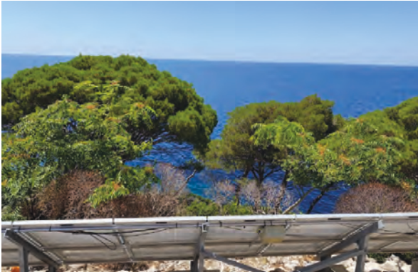
Slika 4. Prikaz pajasena u sastavu tipične mediteranske šume i makije s alepskim borom / Figure 4. View of Ailanthus altissima in the composition of a typical Mediterranean forest and maquis with Pinus halepensis / Izvor/Source: Bogdanović, 2023.