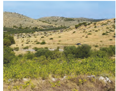
Slika 7. Pajasen u sastavu tipične mediteranske vegetacije suhих travnjaka / Figure 7. Ailanthus altissima in the composition of typical Mediterranean vegetation of dry grasslands