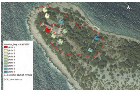
Slika 3. Prikaz istraživanog područja s ucrtanim obuhvatom procjene infestacije (crvena linija) te plohama za kartiranje i prebrojavanje pajasena na otoku Vela Sestrica

Na lokalitetu 1. – otok Vela Sestrica, istraženo je devet ploha. Crvenom linijom prikazan je obuhvat infestiranog područja (Slika 3). Utvrđena je infestirana površina pajasena na sjeverozapadnom dijelu otoka gdje vrsta ulazi u sastav tipične mediteranske šume i makije (Slika 4) u kojoj dominira alepski bor ( Pinus halepensis Mill.) te se povremeno pojavljuju stabla drvenaste mlječike ( Euphorbia dendroides L.). Na jugoistočnom dijelu otoka žljezdasti pajasen nije prisutan, što je utvrđeno detaljnim terenskim istraživanjem (Slika 1).